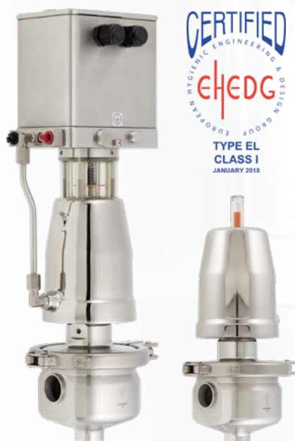
Vanne d'équerre aseptique type 6051: