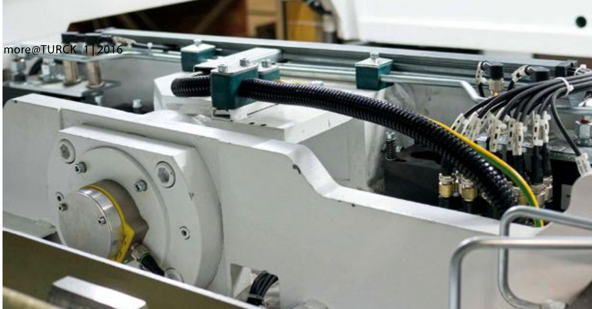
Turcks QR24 IO-Link-Drehgeber erfasst das Schwenken des Kernkastenträgers