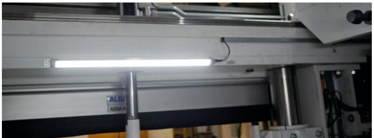
Die dimmbare LED-Maschinenleuchte WLS-28 aus dem Turck-Portfolio wird auch mit Standard-M12-Steckverbindern angeschlossen

Neben dem Kostenvorteil überzeugt der QR24-IOL durch clevere Parametrierungsoptionen. So kann der Anwender den Nullpunkt frei wählen und muss bei Montage und Inbetriebnahme keine Kompromisse eingehen. Das Gerät ermöglicht auch eine vorausschauende Wartung. Neben den 16 Bit, die als Positionssignal